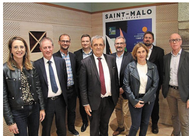
Les partenaires de la ville de Saint-Malo dans le cadre de la Route du Rhum.

Ce partenariat permettra, entre autre, de proposer une animation visuelle et sonore, chaque soir, sur les Remparts. Ce son et lumière permettra de « rendre hommage aux vainqueurs de la Route du Rhum depuis 1978 et d'évoquer les grands naviga-